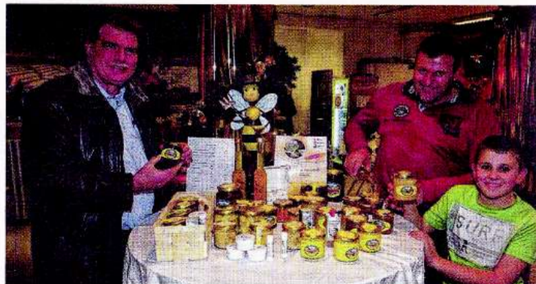
Köstliche Honigprodukte, Kunsthandwerk und mehr gab es auch in den Räumen des FLAX-Jugendzentrums.