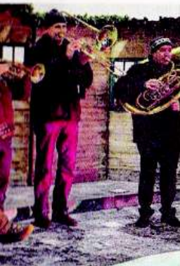
atliche Weisen gehö- Axamer Adventmarkt lardprogramm.