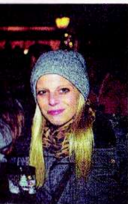
n Glühwein und die tmarkt!